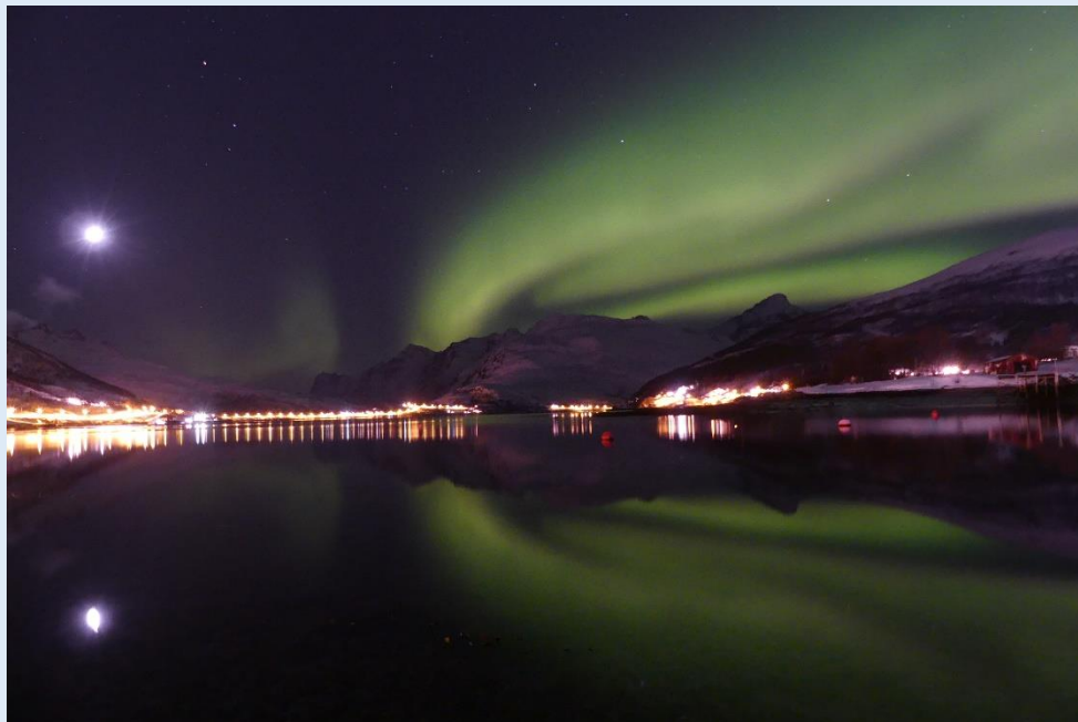
Nordlicht über dem Kaldfjorden

Auf unseren Schneeschuh-Touren sind wir während 4 bis 5 Stunden gemütlicher Gehzeit unterwegs und überwinden dabei 300 bis 500 Höhenmeter. Die Tourenziele passen wir jeweils der Wetter- und Schneesituation an.