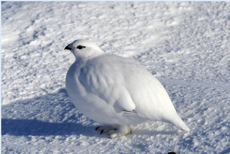
Schneehuhn am Storfjellet

Wenn ich bei Ihnen das Interesse für diese Reise geweckt habe, würde es mich riesig freuen, Sie in meiner Gruppe dabei zu haben.