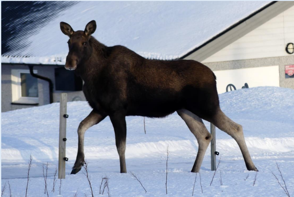
Elch nahe bei der Unterkunft

Für persönliche Beratung stehe ich Ihnen gerne zur Verfügung. Mobile: +41 79 325 81 51 oder bernhard.blaser@nord-zauber.ch